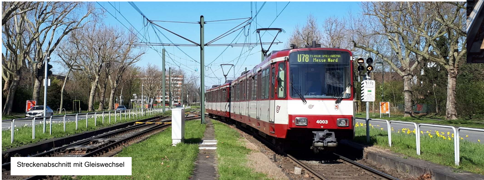
Streckenabschnitt mit Gleiswechsel