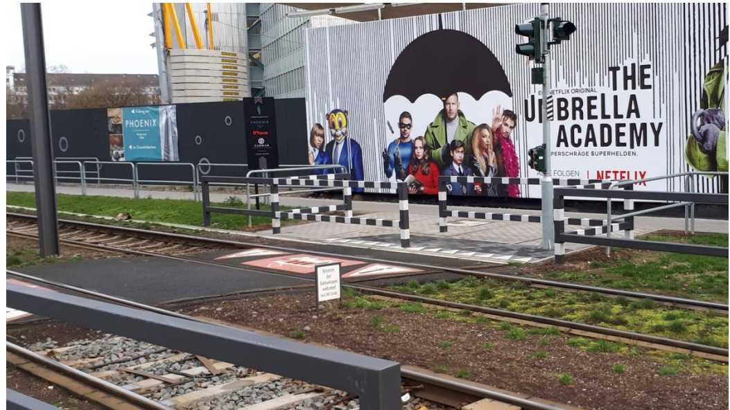
Anlage nach Inbetriebnahme 2019

Die bt-plan führte hierzu Fachplanungsleistungen nach HOAI für die Signalanlage inkl. Kabeltiefbau durch.