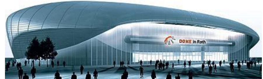
Eisarena „ISS Dome“

Folgende technische Ausrüstung wurde durch bt-plan geplant: