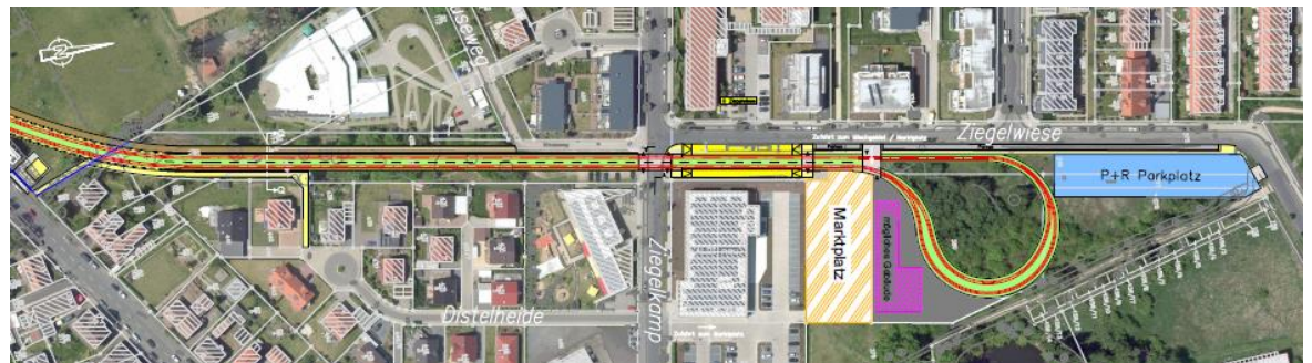
Stadtbahnstrecke 2: Abzweigung Wendescheife