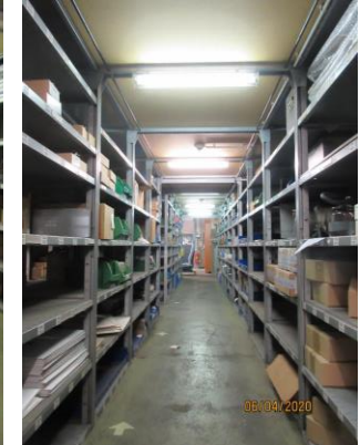
Bestandsleuchten im Lager